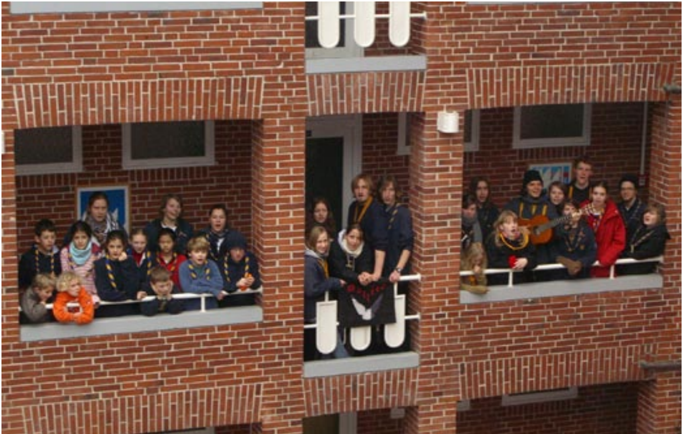
Die Waldreiter beim Landesthinkingday in Kiel