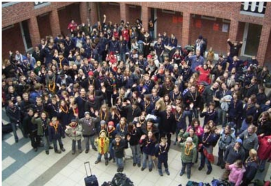
300 PfadfinderInnen aus Schleswig-Holstein winken dem NDR zu.

Nach unserer Ankunft wurden wir erst einmal in unsere Zimmer aufgeteilt und haben gegessen.