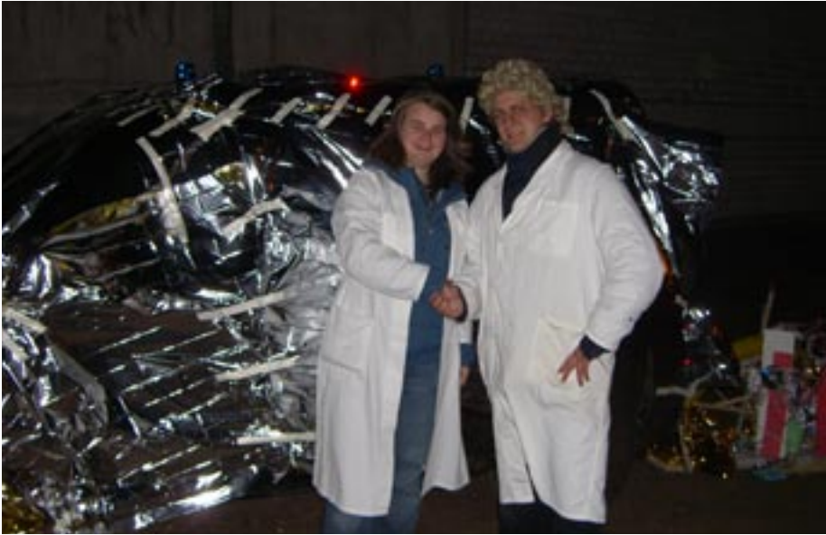
Dipl Ing Chronotius und Prof Nachtigaller nahmen uns mit durch die Zeit.