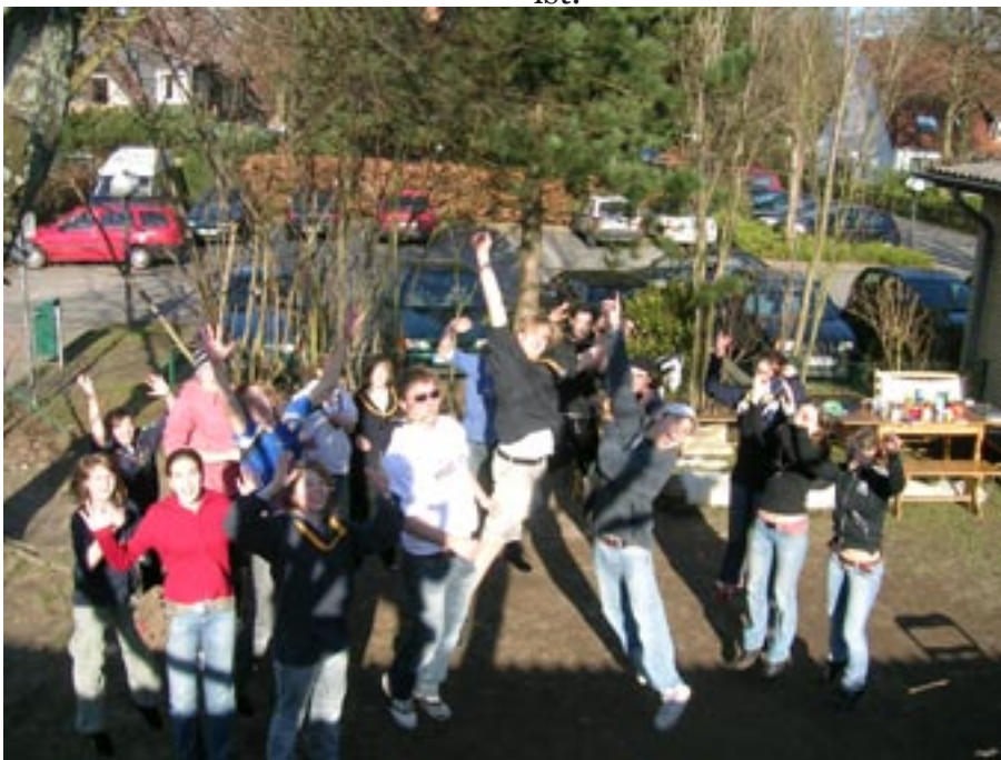
Action für die Kamera ...

Es ist Sonntag; Sonne scheint; die ersten Blumen blühen; Wind weht. Ein neuer Wind weht im kleinen Haus am Kortenkamp direkt neben dem Sportplatz. Es hat sich was geändert und es ist nicht die Tatsache, dass der Frühling vor der Tür steht. Große Politiker würden es Reformen nennen, aber zum Glück sind wir ja keine Politiker.