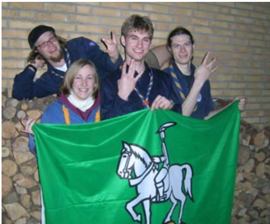
Holzstapel mit Stammesführung